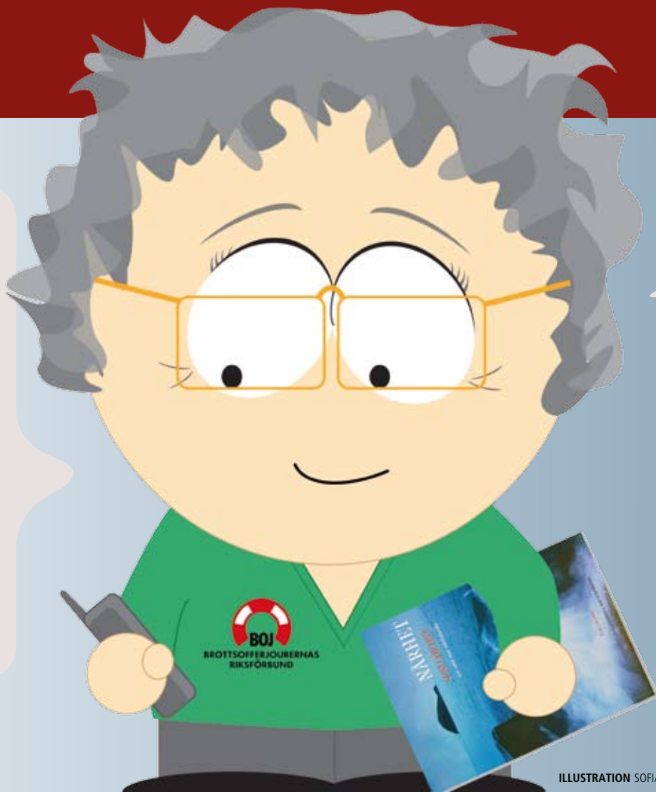
ILLUSTRATION SOFIA BARLIND

Hon är nöjd med att nästan inte ha någon stödkontakt via brev, mail, sms och chatt.